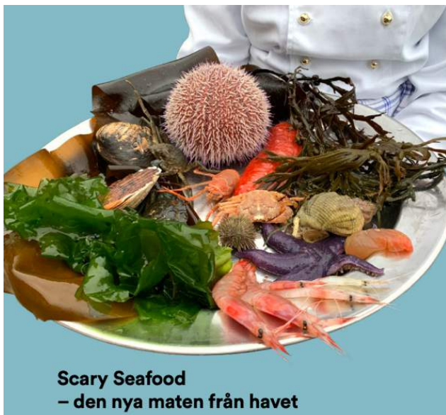
Scary Seafood – den nya maten från havet