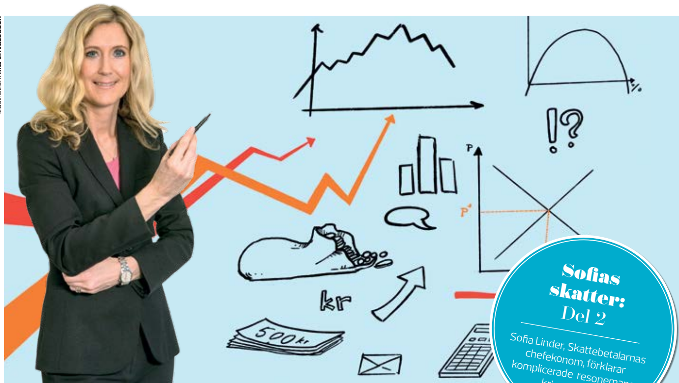
Illustration: Martin Jacobson